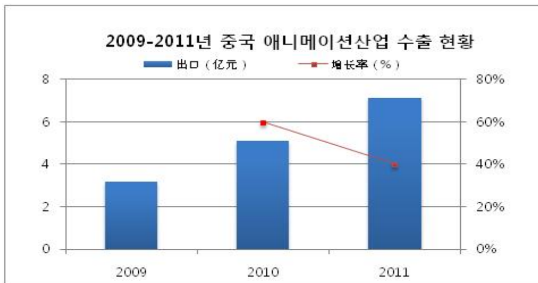
■ 그림 1 ■ 2009-2011년 중국 애니메이션 산업 수출 현황