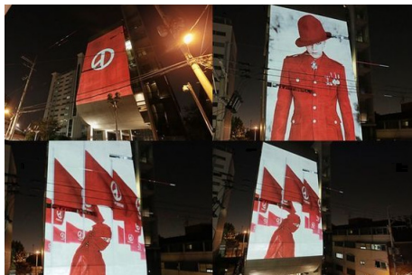
그림 37. YG엔터테인먼트 사옥 외벽을 활용한 지드래곤 음반 홍보 미디어 파사드