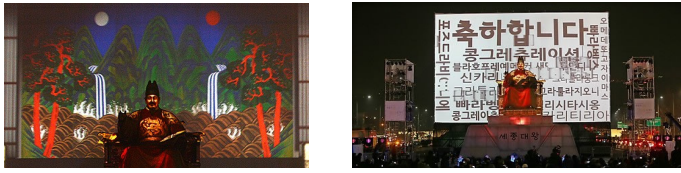
그림 38. (주)비주아스트의 광화문광장 세종대왕 동상 프로젝션 맵핑